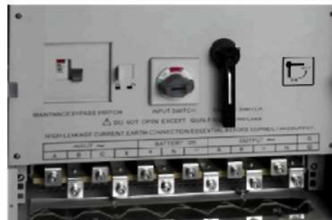
Ручной обходной переключатель, смонтированный в стойку 1.6 м

Подходит для Windows (MS Windows 98 или выше), MAC (OS 10.1 или выше), Linux, Free, BSD, Sun, Novell, и др.